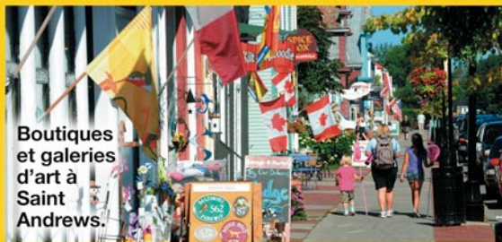
Boutiques et galeries d'art à Saint Andrews.