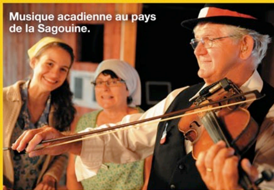
Musique acadienne au pays de la Sagouine.