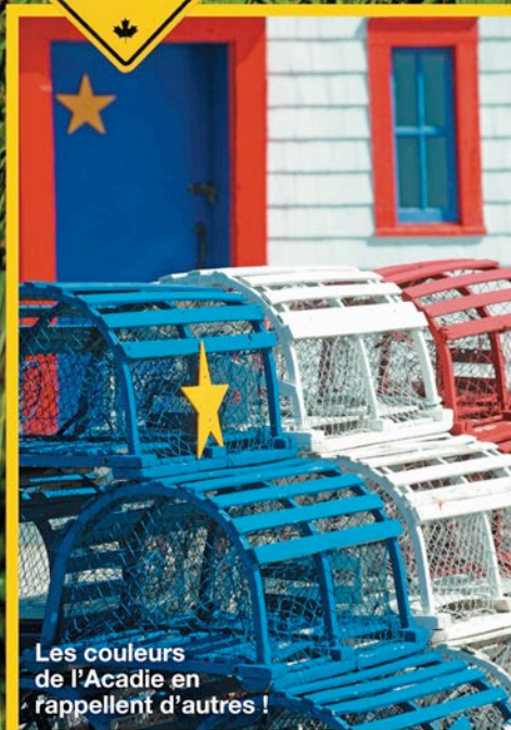
Les couleurs de l'Acadie en rappellent d'autres !