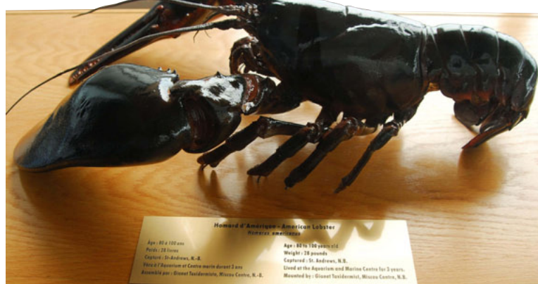
Le Nouveau-Brunswick est le royaume du homard. Un festival lui rend hommage tous les ans. Un peu partout, il y est célébré et savouré à toutes les sauces.

Tant qu'à être à Shédiac, profitez-en pour vous faire photographier à côté de la plus grande sculpture de homard du monde ! Tout à côté, plusieurs boutiques vendent tout ce qu'il est possible d'imaginer comme souvenirs à l'effigie de la bête, du tee-shirt à la peluche en passant par la tasse ou la casquette. Pour une connaissance un peu plus précise de la bes-