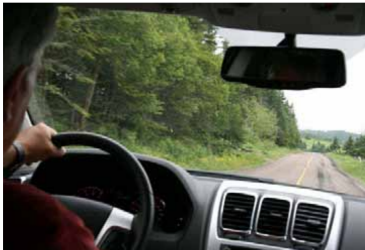
La voiture est indispensable si l'on veut découvrir les fabuleux paysages, sauvages et bucoliques du Nouveau-Brunswick.

« Vous autres, connaissez-vous not pays par là-bas ? » La jeune mère, qui promenait sa marmaille au Village Acadien, a laissé quelques instants ses enfants pour venir au-devant du Français. Confus de voir tant de spontanéité, il faut bien confesser que le voyage a commencé les yeux sur une carte. Trouver le Nouveau-Brunswick. Facile, c'est à l'est du Canada, en dessous du Québec et tout près des États-Unis. Seconde étape, localiser l'Acadie. Là, ça se corse. Internet et dico ajoutant à la confusion, il faut se rendre à l'évidence, l'Acadie n'est pas un pays à proprement parler. Pour bien comprendre, il faut remonter le temps et se souvenir que les premiers colons français sont arrivés en 1604 tout au sud du Nouveau-Brunswick actuel. Ils sont arrivés avec l'expédition menée par Samuel de Champlain.