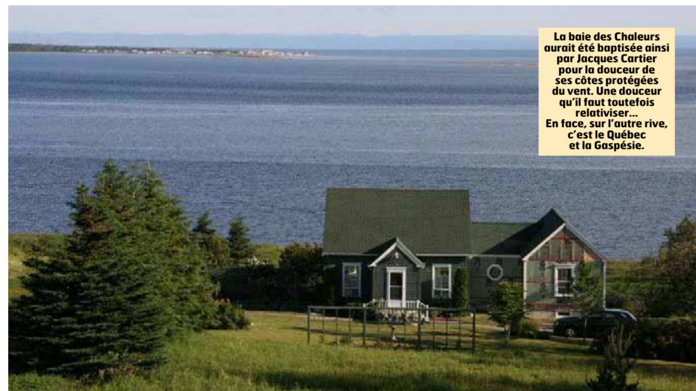
La baie des Chaleurs aurait été baptisée ainsi par Jacques Cartier pour la douceur de ses côtes protégées du vent. Une douceur qu'il faut toutefois relativiser. En face, sur l'autre rive, c'est le Québec et la Gaspésie.

Parcourir le Nouveau-Brunswick, et plus encore l'Acadie, c'est un peu se retrouver en Belgique. Deux communautés tentent de cohabiter et, sur la route, les villages sont bien différenciés, francophones et anglophones ne se mélangent pas, du moins en zone rurale. Cela