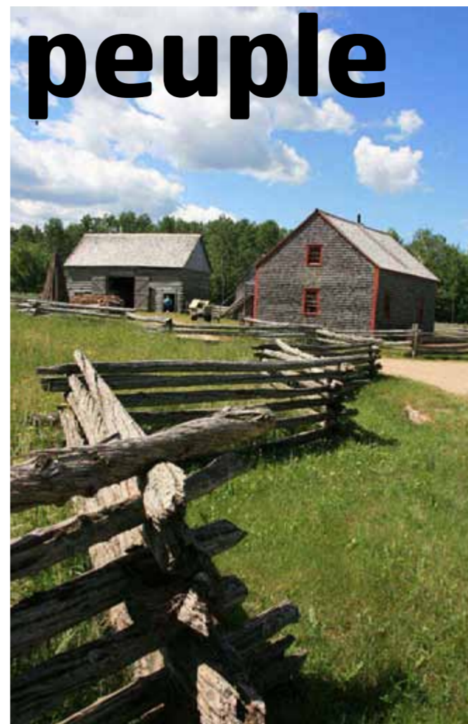
Dans une vaste clairière pas bien loin de Caraquet, la culture des irréductibles Acadiens est bien vivante.