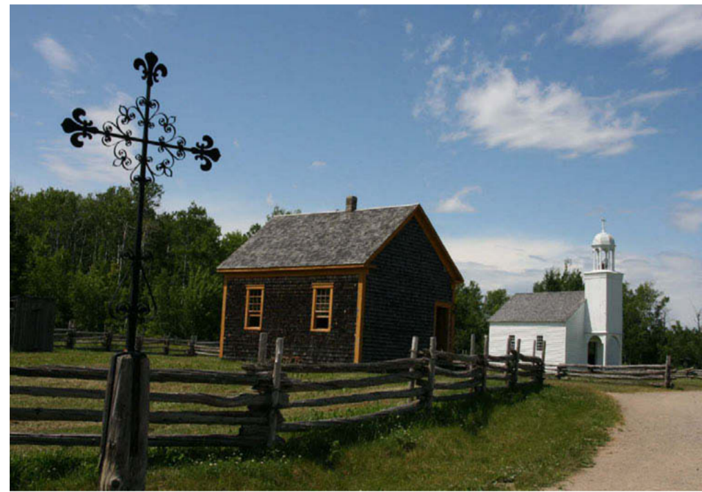
L'école (à gauche) a été récupérée dans le sud de la province, la chapelle en bois à Caraquet. Elles ont été remontées côte à côte car éducation et religion sont longtemps allées de pair en Acadie.

Chaque été, dans ce lieu-dit bucolique, posé tout en haut du Nouveau-Brunswick, les Acadiens renouent avec leur histoire et retrouvent des racines. Après avoir été chassés de leurs terres ancestrales (en Nouvelle-Ecosse et au sud du Nouveau-Brunswick actuels), leurs aïeux qui échappèrent au Grand Dérangement et les autres qui revinrent de déportation en 1763, ont débuté une nouvelle vie en s'installant à proximité de la baie des Chaleurs. Passés maîtres dans l'art d'assécher les marais, ces volontaires sont parvenus à rendre cultivables des terres pourtant peu nourricières. Et lorsqu'il a été question, dans les années 1970, de préserver l'histoire de ces « défricheurs d'eau » qui ont sauvé le peuple acadien, le site de Rivière-du-Nord s'est tout naturellement imposé. D'anciennes « levées » et des « aboiteaux » tout droit venus du XVIII e siècle étaient encore en place. En bordure d'une forêt d'épinettes noires et de bouleaux nains, sur des terres prises aux marais, des maisons, des granges et tout une kyrielle de constructions en bois datant de 1770 au milieu du XX e siècle ont été remontées pour constituer un village.