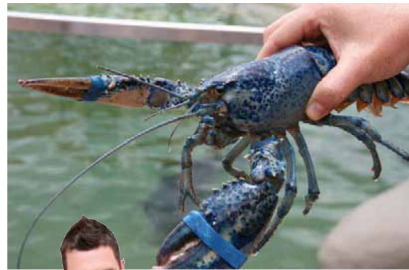
Pour en voir des tout bleus, c'est à l'Aquarium de Shippagan qu'il faut se rendre.