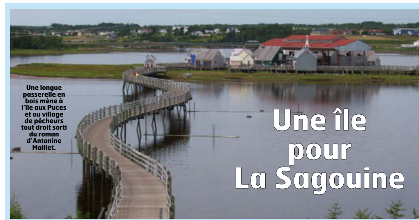
Une longue passerelle en bois mène à l'île aux Pucés et au village de pêcheurs tout droit sorti du roman d'Antoine Maillet.