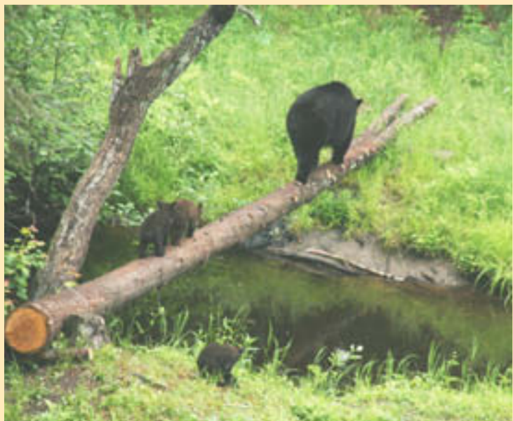
Après la pause-repas, retour au bercail pour cette mère et ses galopins.