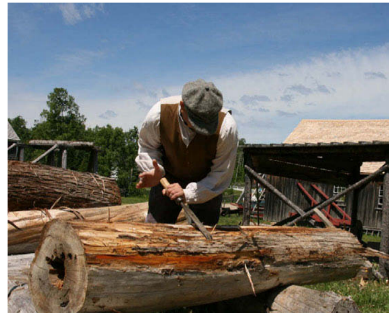
Une scierie au Canada, jusque-là rien d'extraordinaire. Mais ici le travail se fait comme au XVIII e siècle, en utilisant les outils d'antan.

HÉRITAGE. Dans une vaste clairière, à quelques encablures de la baie des Chaleurs, les Acadiens ont retrouvé leurs racines. En redonnant la vie à un village comme il en existait jadis, ils prouvent, fiers et tenaces, qu'ils sont toujours bien là dans un monde qui a trop tendance à tout vouloir uniformiser.