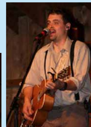
C'est un spectacle « à la journée longue » qui est proposé chez les « Bootleggeux » (les as de la contrebande). Les monologues de La Sagouine, « Y'a beau temps que j'vous espérions icitite », alternent avec des concerts. Le violoneux est sur scène. « Un violoneux c'est un violoniste mais qui, en plus, a la swingue ». La musique est très entraînante et donne envie de taper du pied. « On dit que les Acadiens dansaient assis à cause des prêtres qui n'appréciaient pas la danse. Du coup, ils restaient assis et... tapaient des pieds. »

Au Prix Gongourt reçu en 1979 pour le livre Pélagie la charrette -qui traitait du Grand Dérangement- s'ajoutait en 1992 une drôle de récompense pour Antoine Maillet. Sur un îlot posé dans les marais de Bouctouche, sa ville natale, l'univers de La Sagouine va être fidèlement restitué. Un village de pêcheurs du début XIX e , plus vrai que nature, a vu le jour. Chacune des maisons de bois colorées abrite un des personnages typiques du roman. Et, pour cette reconstitution littéraire ne soit pas un simple musée, des acteurs en costumes d'époque sont là pour donner de la vie avec une gouaille sympathique. Plus loin, c'est la Sagouine en personne qui philosophe : « Salut les Français. On a le même sang dans nos veines. On avait de la parenté et on ne le savait même pas ». Et un ton plus bas, au cas où un anglophone serait présent dans la salle : « Citite, on est assimilés à 100 milles à l'ure, prenez garde ». Tout au long de la journée, les animations s'enchaînent au milieu de la