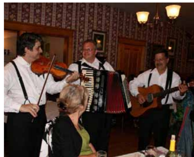
Comme les aïeux qui passaient leurs veillées en musique, il est possible de terminer, en swingant, sa journée au Village.