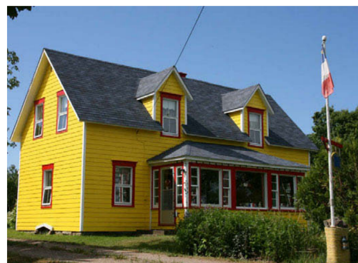
La véritable capitale de l'Acadie, là où bat le poulx culturel de la communauté, c'est Caraquet, coquette bourgade où le marchand de peinture a dû faire fortune et où il fait bon poser ses valises.

Le drame survient en 1755 lorsque les Anglais décident d'expulser de force les Acadiens, confisquant au passage terres et maisons. Ce tragique épisode de l'histoire acadienne est connu sous le nom du Grand Dérangement. Embarqués de force sur des chaloupes puis chargés sur des navires partant vers l'exil, 8.000 à 10.000 hommes, femmes et enfants seront dispersés entre les États-Unis, le Québec, la Louisiane, l'Angleterre et la France. Les familles furent à jamais dispersées. Lorsque les rescapés, surnommés les « piétons de l'Atlantique » purent revenir, ils trouvèrent des colons anglais sur