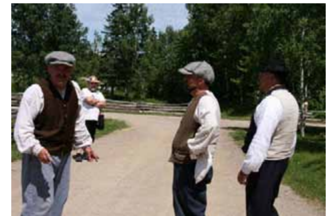
Au début du XX e siècle, les Acadiens ont commencé à s'intéresser à la politique. Dans les rues du Village, la colère gronde. Les visiteurs sont invités à participer à leur assemblée et à écouter leurs doléances.