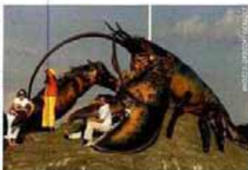
A gauche : des casiers peints en bleu, blanc, rouge (avec une touche de jaune) rappellent une France toujours présente au cœur des Acadiens. Ci-dessus : à l'entrée de Shediac, un homard en pince pour les touristes !

L est séduisant, tendre et rare. Peut-être aurez-vous la chance de voir le célèbre homard bleu en découvrant le Nouveau-Brunswick, l'autre province bilingue du Canada. En 1604, Bretons et Normands débarquèrent et fondèrent l'Acadie. Leurs descendants à l'accent chantant forment une communauté accueillante et joyeuse. Tous les 15 août, le petit port de pêche de Caraquet se livre à un fameux « Tintamarre ». Des milliers de personnes munis d'instruments improvisés déferlent dans les rues. C'est la fête « nationale » des Acadiens. Ils accourent par milliers du monde entier pour y retrouver une