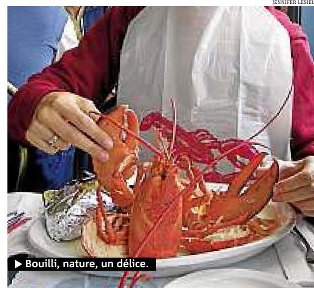
► Bouilli, nature, un délice.

rarissimes, dont l'incroyable homard bleu, un défaut de pigment qui arrive une fois sur 4 millions. De petites croisières montrent comment on les pêche avec des casiers, en respectant des normes strictes. Quelques conseils de cuisson (bouilli, c'est mieux !) et hop, on déguste sur l'eau. Un vrai bonheur qui mérite tout le voyage. ● J.L. www.lobstertales.ca