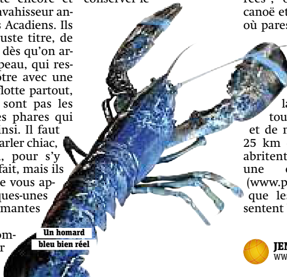
Un homard bleu bien réel

Village historique acadien, près de Caraquet, donne une idée de la vie quotidienne des Acadiens de 1770 à 1939. Les "villageois" sont habillés et se comportent comme à l'époque de leur maison ; peut-être vous inviteront-ils à leur table pour une bonne fricassée de pommes de terre cuisinée avec les ustensiles d'époque. Plus loin, un tonnelier fabrique les tonneaux jadis utilisés pour conserver le