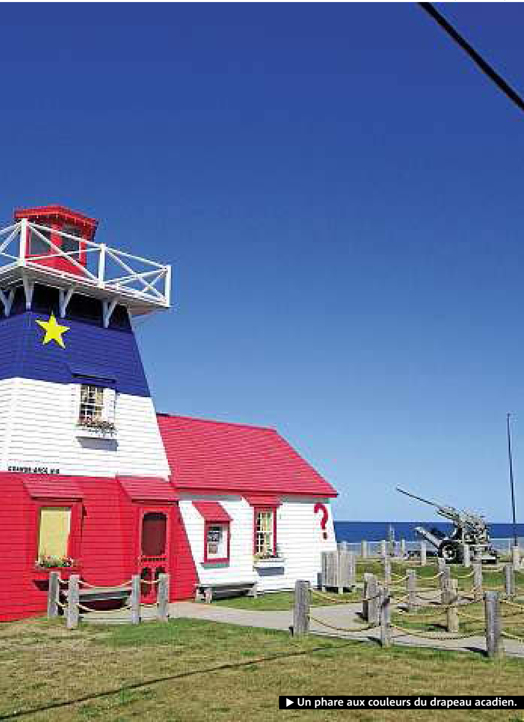
► Un phare aux couleurs du drapeau acadien.