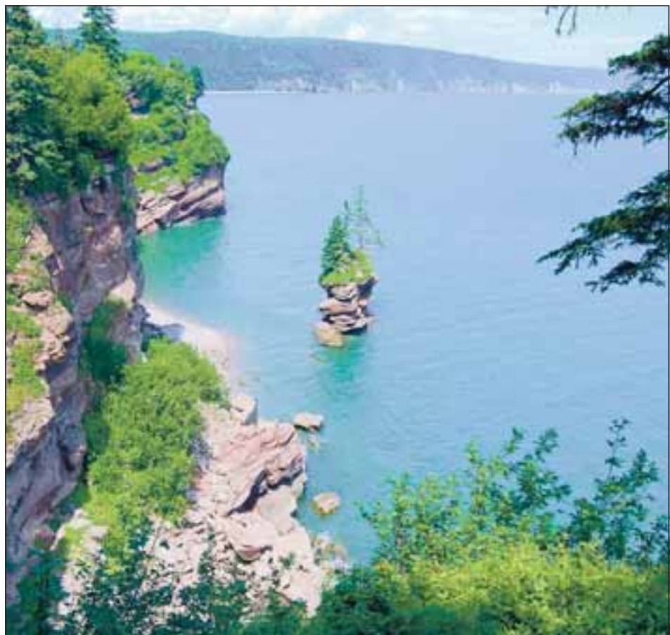
● Falaises, criques et forêts sauvages peuplées d'originaux, d'ours et de ratons-laveurs. Ici, le sentier côtier particulièrement sportif du « Fundy trail », 80 kilomètres de nature intacte, loin de toute civilisation. Il faut trois jours de marche et de bivouacs à des randonneurs entraînés pour le parcourir.

Mais les choses évoluent. « On rencontre de plus en plus de jeu-