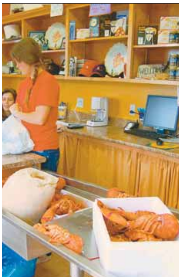
● On peut faire ses emplettes de pique-nique dans une petite pêcherie de bord de plage. À 5 € le homard, pourquoi se priver ?