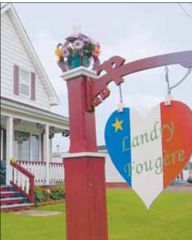
● Les Acadiens affirment leur identité en bariolant maisons, bâtiments et panonceaux aux couleurs de leur drapeau bleu-blanc-rouge frappé de l'étoile d'or de l'Assomption.

C'est un pays de plages et de falaises, de rias et de criques, de pêche et de tourisme. Un pays vallonné où l'été est doux. Ses habitants, attachés à leur histoire et à leurs traditions régionales, se battent pour que vivent leur langue et leur identité. Là-bas, de l'autre côté de l'Atlantique, la péninsule acadienne est comme une autre Armorique, plantée au bout de l'État canadien du Nouveau-Brunswick.